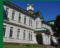
所在地:札幌市北区北9条西7丁目 (北海道大学構内) 交通:JR札幌駅西口より徒歩約10分