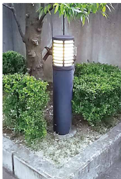
照明ポール等で使用