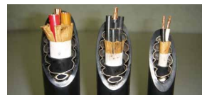
より合わせ形コルゲートケーブルのイメージ図