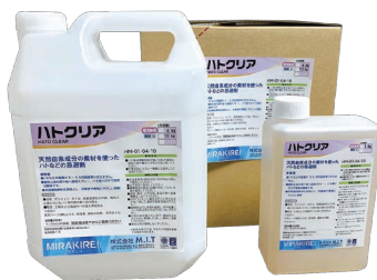
ハトクリア 1kg・4kg・10kg入り各容器