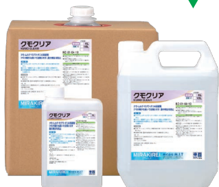
クモクリア 1kg・4kg・10kg入り各容器