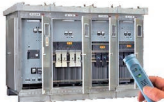
キューピクル絶縁不良チェック

リーケージ・チェッカーは、電力機器の絶縁不良時に発生する40kHzの超音波を検知すると可聴音へ変換し、50dB(要観察・再測定)70dB(要精密点検)の音圧をLED表示でお知らせします。