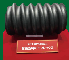
古河電工から提供した 発売当時のエフレックス