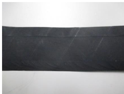
変更前:ナイロクロス