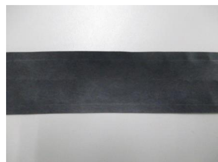
変更後:カーボン紙